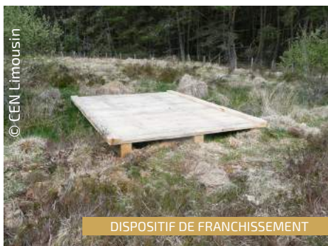
DISPOSITIF DE FRANCHISSEMENT