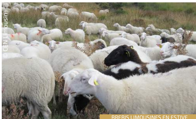
BREBIS LIMOUSINES EN ESTIVE