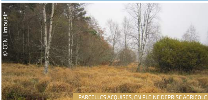
PARCELLES ACQUISES, EN PLEINE DEPRISE AGRICOLE