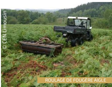
ROULAGE DE FOUGÈRE AIGLE

En 2019, la transhumance jusqu'aux sources de la Vienne est ouverte au grand public et s'inscrit dans le programme «De Villages en sonnailles», en partenariat avec le GP et le PNR Millevaches en Limousin. Les randonneurs accompagneront le troupeau avec les bergers, et un pique-nique à base de produits locaux est prévu par les organisateurs. Au total, 6 balades auront lieu en 2019 sur le territoire du PNR Millevaches, dont 1 sur le site des sources de la Vienne.