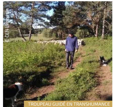
TROUPEAU GUIDÉ EN TRANSHUMANCE