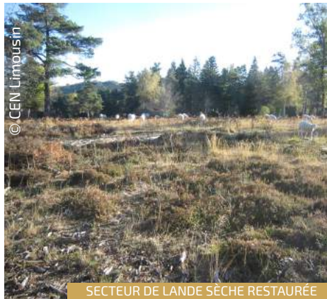
SECTEUR DE LANDE SÈCHE RESTAURÉE