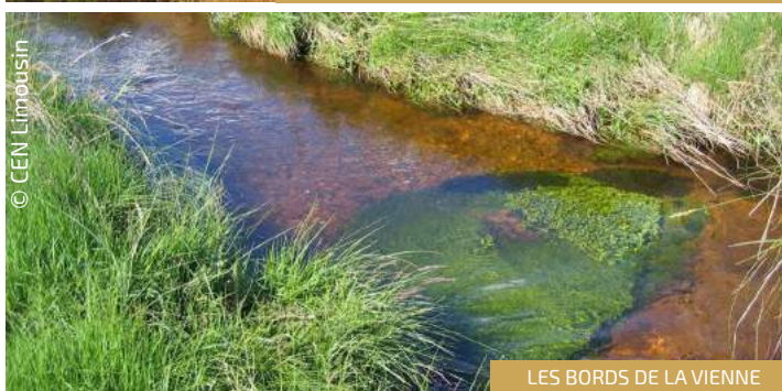
LES BORDS DE LA VIENNE

Le site des « Sources de la Vienne » géré par le CEN se trouve en Corrèze, sur le Plateau de Millevalches à plus de 800 mètres d'altitude. Le sous-sol est granitique et confère une certaine acidité à l'eau et au sol. Le site illustre bien l'unité paysagère typique du Plateau de Millevalches, constitué d'alvéoles avec un fond plat hydromorphe et des versants secs aux sols drainants et oligotrophes. Situé sur la frange occidentale du Massif-Central, le secteur est marqué par l'importance des espèces d'affinité montagnarde et boréale, mais également par des espèces d'affinité atlantique.