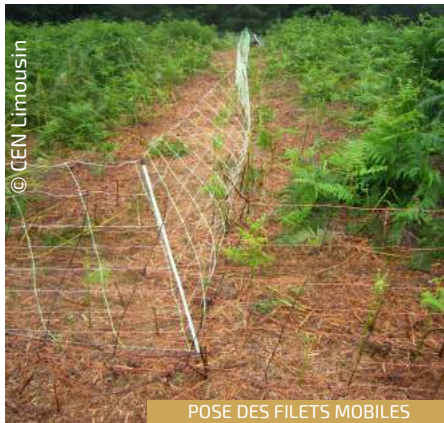
POSE DES FILETS MOBILES