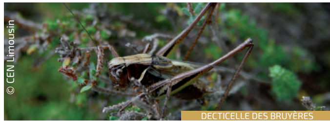
DECTICELLE DES BRUYÈRES

Le premier enjeu sur le site est la fonctionnalité des zones humides, les actions conservatoires visant les tourbières et leurs milieux associés sont ici primordiales. La gestion doit passer par la maîtrise foncière des zones abandonnées et nécessite la disponibilité de troupeaux pour les entretenir. La préservation de l'intégrité du cours d'eau constitue le second enjeu pour la préservation de la ressource en eau.