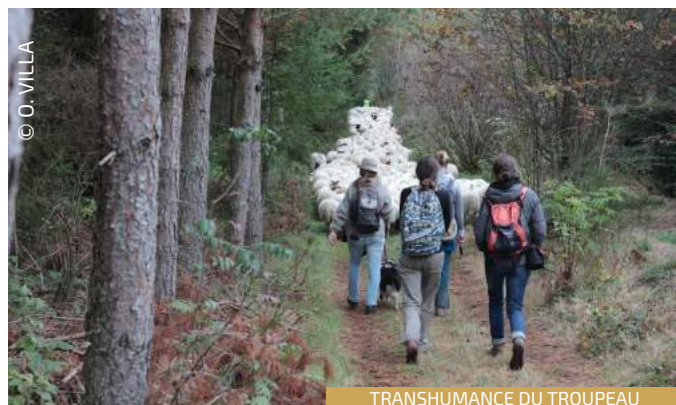
TRANSUMANCE DU TROUPEAU

Les milieux agropastoraux emblématiques du plateau ont été façonnés par le pastoralisme itinérant, qui a disparu vers le début du XX e siècle. La surface importante en maîtrise foncière in situ est discontinue, mais se prête à la conduite de troupeaux en estive. La gestion de ces milieux par un pâturage en parcs fixes est généralement moins bénéfique pour les milieux et les espèces qu'un chargement fort itinérant (troupeaux gardés et/ou parcs mobiles). Il faut également que le troupeau soit conduit en fonction d'objectifs de conservation des habitats naturels.